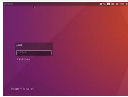
デスクトップ版でのログイン時のバージョン