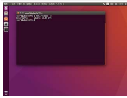
コマンドからのバージョン確認例